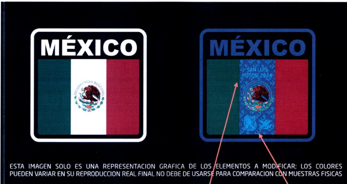
Vista con luz natural

Bandera de México para hombro izquierdo de camisa y chamarra.