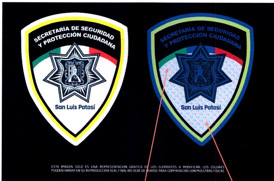
Vista con luz natural