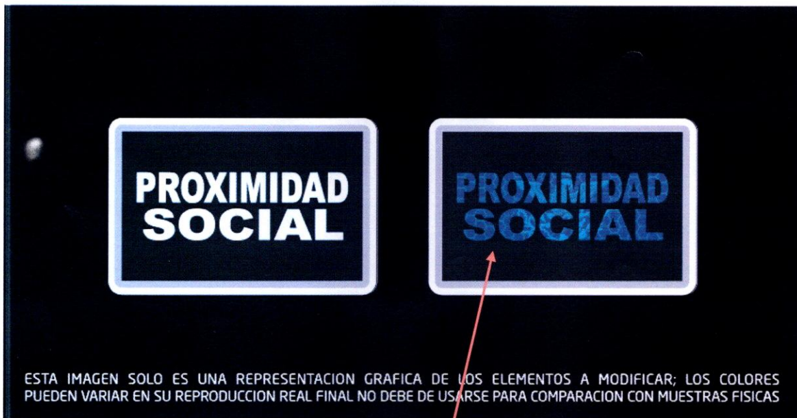
Vista con luz natural

Sector de Proximidad Social. Deberán tener en la codificación UV un panel que se distinguirá solamente en la Palabra Proximidad Social el Águila Juarista, medida 5cm alto por 7.62 de ancho bordado en la manga derecha.